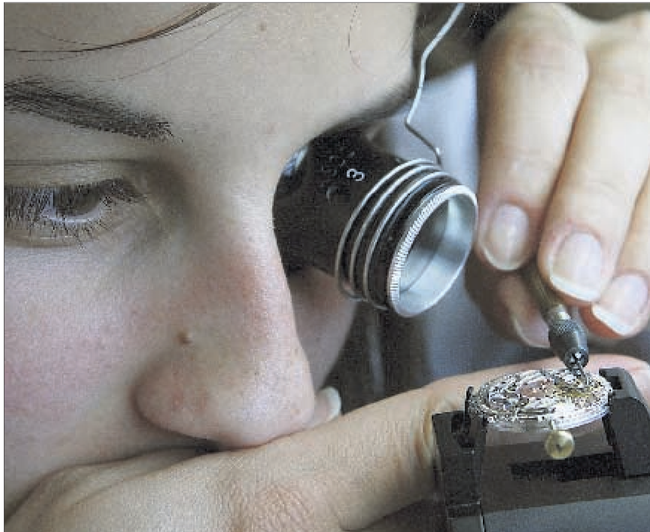
HANDARBEIT Eine Uhrmacherin beim Abstimmen eines Werks am Hauptsitz von Vacherin Constantin in Genf.

Im Februar brachen auch die Exporte in andere grosse Märkte