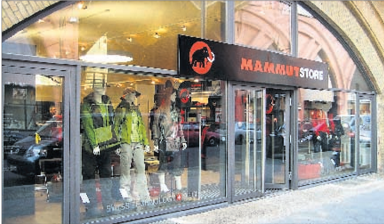
EINER VON DREI SHOPS IN DEUTSCHLAND Anfang April eröffnetes Mammut-Geschäft in Berlin. 40

Der Trend ist klar: Sportartikel-Hersteller setzen immer stärker auf Geschäfte, die ausschliesslich ihre Produkte anbieten. So hat Wolfskin die Zahl dieser Mono-Brand-Stores in den letzten drei Jahren etwa verdoppelt und unterhält europaweit über 200 Geschäfte. Mammut, der in der Schweiz bislang mit einem Geschäft in Basel vertreten war, möchte hierzulande auf fünf bis sechs Shops kommen, in Deutschland soll die Zahl von heute drei auf zehn bis zwölf steigen. Betrieben werden die Geschäfte üblicherweise im Franchising-System, das heisst, ein fremder Unternehmer