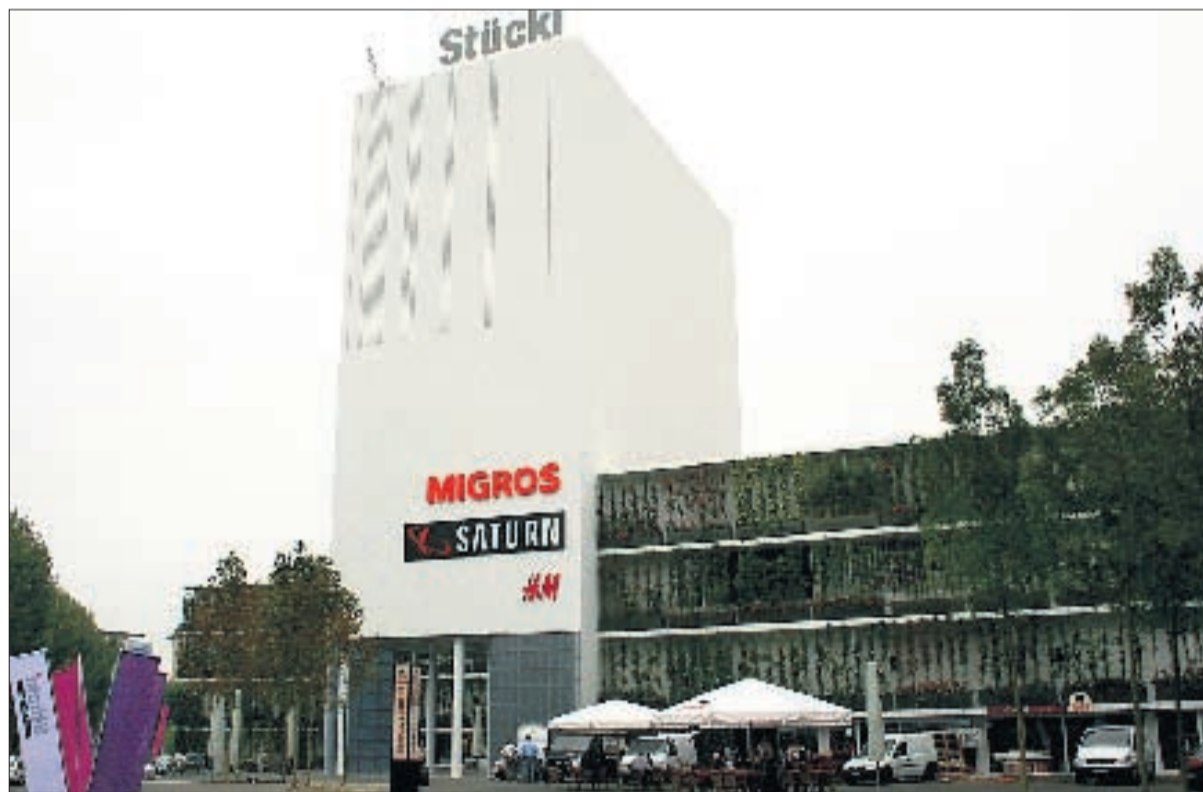
DAS NEUESTE SCHWEIZER EINKAUFSLAND Ladenpassage im Basler Stücki-Shopping. HEINZ DÜRRBERGER

32 000 Quadratmeter, 120 Shops, mehrere Restaurants, ein Hotel und über 800 Parkplätze gehören zum Konsumtempel, der auf den Brachen der ehemaligen Stückfärberei steht. Einst arbeiteten rund 700 Leute in der Färberei, in den 80er- und 90er-Jahren nahm die Party- und Kulturszene das Industrieareal in Beschlag und ab heute sorgen gegen 1000 Angestellte in den verschiedenen Betrieben für – kalkulierte – gute Umsätze und – hoffentlich – zufriedene Kunden. Diese erwarten neben der von vielen zarten Pflanzen umrankten weissen Gebäudefassade (Diener & Diener Architekten) die üblichen Geschäfte wie H&M, Marionnaud, Visilab, Herren-Globus sowie die erste Schweizer Filiale des deutschen Unterhaltungselektronik-Discounters Saturn und eine Migros-Filiale mit einem neuen Ladenkonzept. (THA)