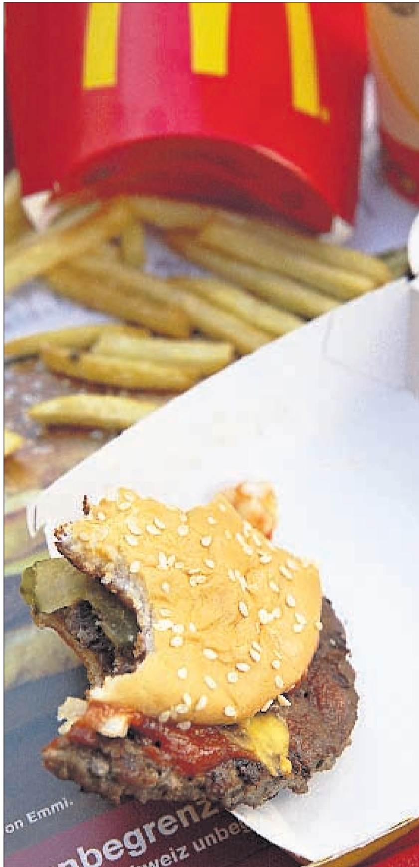
1. RESTE EINES BIG MAC Bei den 147 McDonald's-Filialen in der Schweiz landen jedes Jahr 500 Tonnen Lebensmittel im Abfall. SUSI BODMER

Per Lastwagen gelangen die Burger zur Firma Kompogas in Otelfingen ZH. Der Geruch vor der Anlage ähnelt dem eines Kuhstalls. In einem ausgeklügelten Prozess werden nicht kompostierbare Stoffe wie Metall und Plastik aus dem organischen Abfall ausgesondert. Der Rest durchläuft einen Fermentierungsprozess, bei dem sich die energiereichen Methangase und Kohlendioxid nach und nach herauslösen. Diese verfeinert die Firma zu Biogas und verkauft dieses an McDonald's, Migros, Coop und an an schweizweit 700 Tankstellen auch an Privatpersonen. Der gepresste Kompost wird auch als Flüssigdüng-