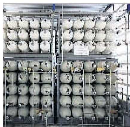
4. BIOGASFLASCHEN So sieht das Endprodukt aus: Biogas, das zum Heizen, für die Stromproduktion oder als Treibstoff genutzt wird. Biogas ist ein Drittel billiger als Benzin, Biogas-Autos stossen kein CO 2 aus.