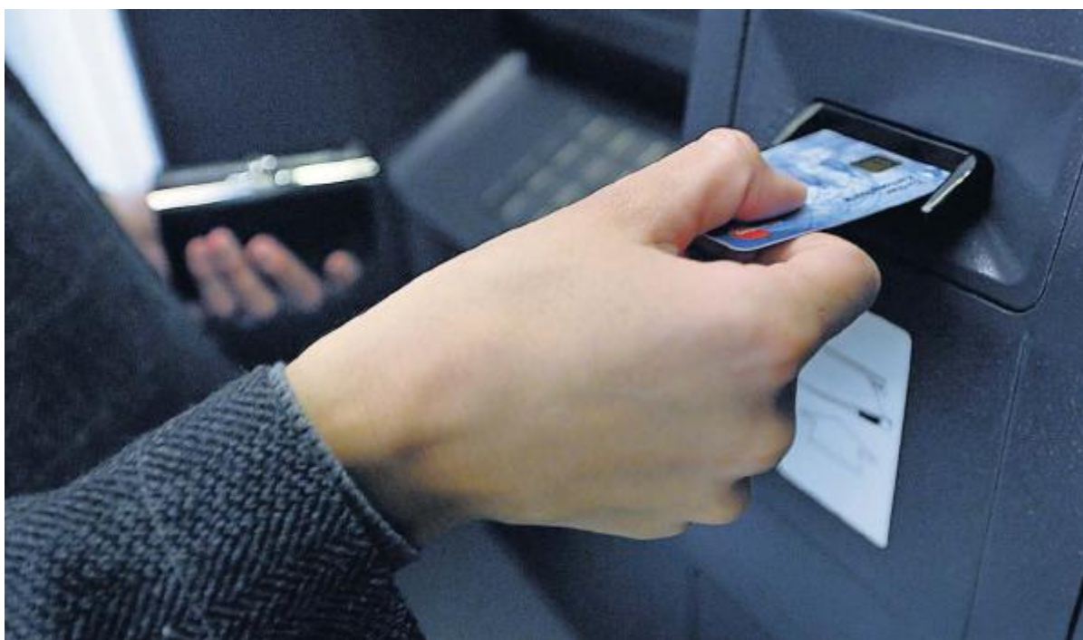
KNACKPUNKT JAHRZAHL Die fraglichen EC- und Kreditkarten haben Probleme mit Daten anno 2010.

Seit dem Jahreswechsel sorgen in Deutschland EC- und Kreditkarten auf breiter Front für rote Köpfe. Die Probleme betreffen sowohl den Bargeldbezug an Bancomaten als auch den Karteneinsatz im Handel. Auslöser sind Karten, deren Sicherheits-Chip einen Programmierfehler aufweist. Konkret können Transaktionsdaten mit der Jahreszahl 2010 nicht korrekt verarbeitet werden. Zu den Kartenherausgebern gehören sowohl deutsche Grossbanken als auch Landesbanken und Sparkassen.