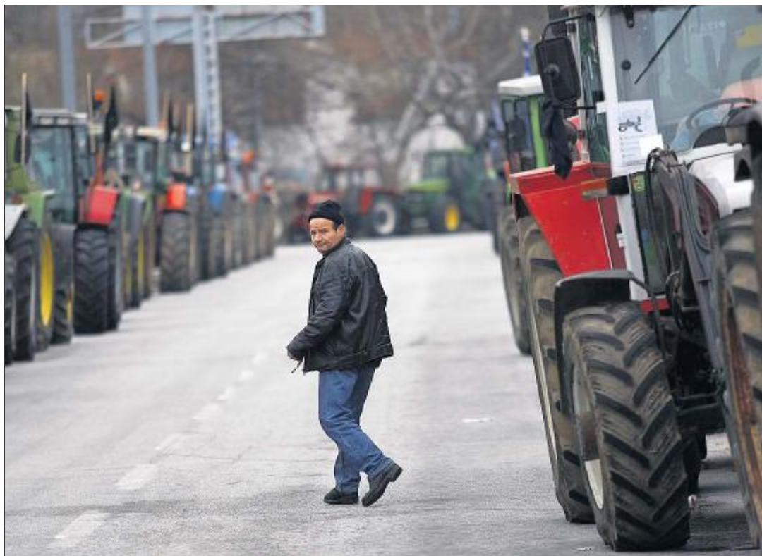
«SUBVENTIONEN ODER WIR BLEIBEN» Strassenblockade griechischer Bauern.

«Rettungspaket mit schmerzhaften Massnahmen» lautete der Tenor in der Athener Zeitung «Ta Nea»: Kürzung der Gehälter zwischen 4 und 6 Prozent beim Staat; niemand wird in diesem Jahr im öffentlichen Dienst eingestellt. Alle Ministerien und staatlichen Unternehmen müssen ihre Budgets um 10 Prozent kürzen. Auf Immobilien werden neue Steuern erhoben. Treibstoff soll mit einer neuen Steuer von 7 Cent belastet werden. Zigaretten und Spirituosen sind schon 20 Prozent teurer geworden. Die Steuerbeamten sollen Rechtsanwälte und Ärzte, aber auch Klempner, Elektriker und Händler, die keine Rechnungen ausstellen und somit die Mehrwertsteuer nicht zahlen, schärfer kontrollieren. Wer Informationen liefert, die zur Erfassung von Steuerhinterziehern führen, soll mit Steuererleichterungen belohnt werden.