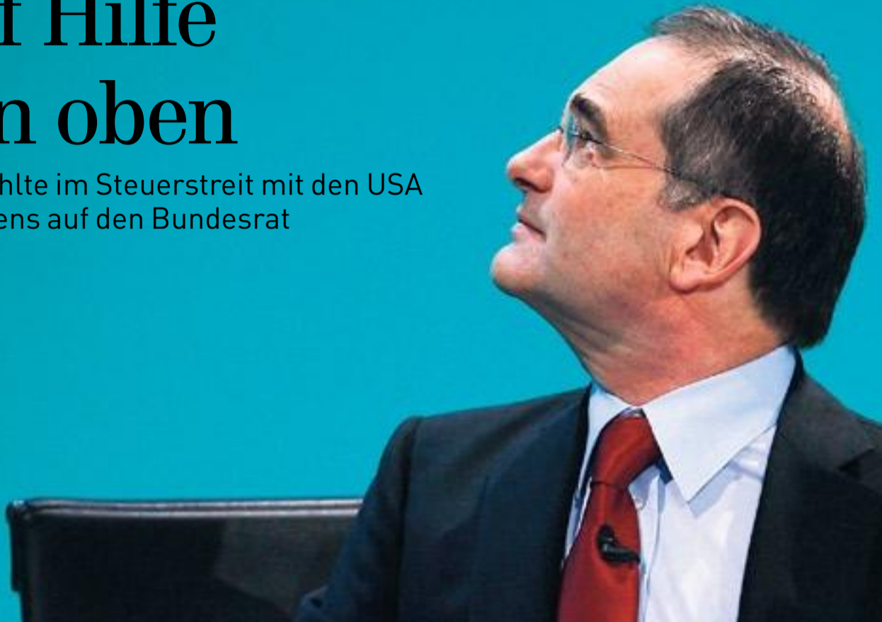
UBS-Verwaltungsrats-Präsident Peter Kurer befürchtet weitere Zwangsmassnahmen der USA

UBS zählte im Steuerstreit mit den USA vergebens auf den Bundesrat