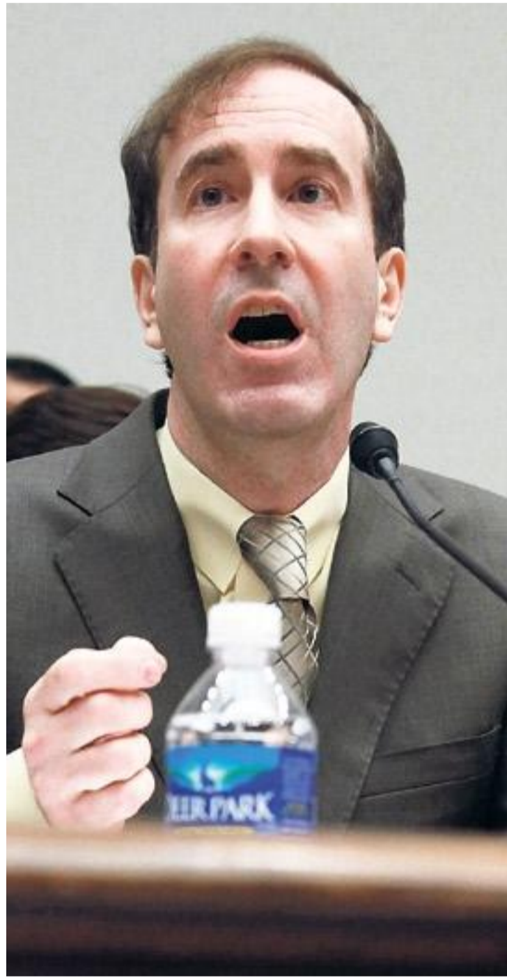
Held Markopolos, 52: Konspiration der SEC-Anwälte?

Empört über die Enthüllungen, nahmen Abgeordnete die nach Markopolos auftretenden SEC-Oberen aufs Korn. «Ihr habt in eurer Mission total und gründlich versagt», wettete Gary Ackerman aus New York. Vollzugschefin