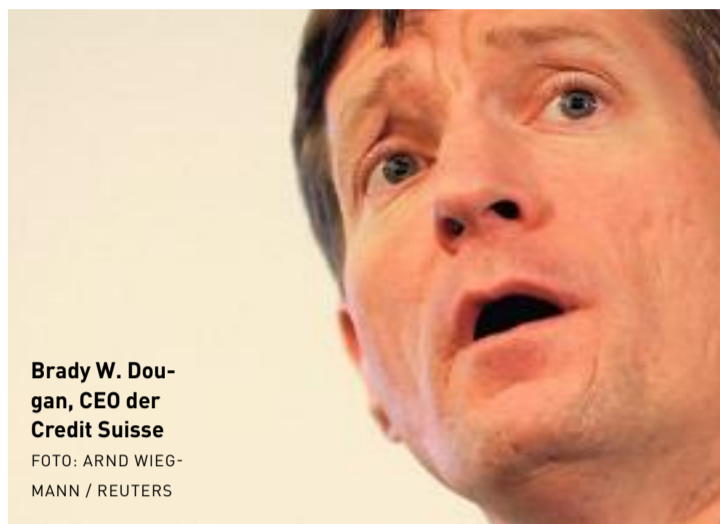
Brady W. Dougan, CEO der Credit Suisse