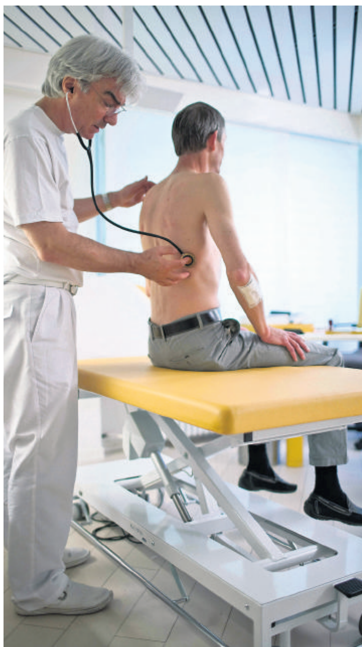
Untersuchung beim Hausarzt: Behandlung ohne Mehrkosten

Auch die SP setzt sich für einen Wechsel ein, wie sie in einer letzte Woche eingereichten dringlichen Interpellation einmal mehr bekräftigte. «Die Versicherungen müssen gezwungen werden, in allen Regionen Hausarztmodelle anzubieten», sagt SP-Vizepräsidentin Jacqueline Fehr. Das von CVP und SVP verlangte Obligatorium sieht sie kritisch, da in vielen abgelegenen Regionen gar keine Managed-Care-Modelle angeboten werden. «Diese Patienten würde man für die Unterlassung der Versicherungen bestrafen.»