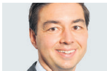
CHRISTIAN UNGER CEO Ringier

Wegen der angespannten Wirtschaftslage werden die privaten Haushalte ihre Ausgaben im kommenden Jahr einschränken. Auf nicht notwendige Anschaffungen, Reisen und teure Freizeitvergnügen wird eher verzichtet. Dafür leistet man sich den kleinen Luxus im Alltag: einen Tagesausflug, eine Delikatesse mit einem guten Wein dazu oder ein neues Accessoire. Eine wirtschaftliche Entspannung wird sich erst im Jahr 2011 abzeichnen.