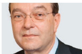
OSWALD GRÜBEL CEO UBS

Die Schweiz hat mit ihrer multikulturellen Ausrichtung ein Markenzeichen und eine Stärke – diese sollte sie mehr und selbstbewusster einsetzen.