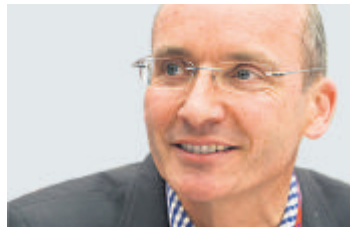
URS RIEDENER CEO Emmi

Wir werden nach dieser Krise mit veränderten Konsumenten zu tun haben. Grundlegende Werte werden sich verschoben haben. Unternehmen, die sich jetzt schon mit diesen Konsumenten auseinandersetzen und sich darauf vorbereiten, werden überdurchschnittlich vom Aufschwung profitieren.