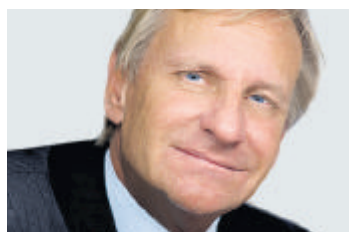
GUIDO EGLI CEO Mövenpick

Die Schweiz meistert die Wirtschaftskrise besser als viele andere Länder. Wir sollten deshalb den nächsten Aufschwung und die Wettbewerbsfähigkeit der Schweizer Firmen nicht durch Überregulierung hemmen. Mein Wunsch ist ein wirtschaftspolitisches Umfeld, das den Standort Schweiz langfristig stärkt. Dazu gehören Themen wie die Bekämpfung von Arbeitslosigkeit und Staatsverschuldung sowie die Sicherung eines attraktiven Finanzplatzes.