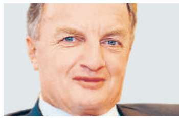
HANS-PETER ROHNER CEO Publigroupe

Ein Treiber für den Konjunkturaufschwung in der Schweiz sind Investitionen in energieeffiziente Systeme. Es gibt keinen Grund, solche Investitionen aufzuschieben, denn die Kosten amortisieren sich innerhalb kürzester Zeit.