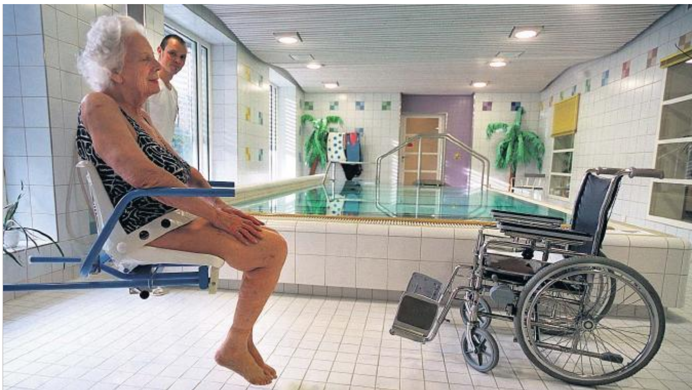
KOSTENTREIBER Reha-Institutionen sowie Alters- und Pflegeheime lassen die Gesundheitskosten in Zukunft weiter steigen.

«Das Gesundheitswesen entwickelt sich zu einem immer wichtigeren Wirtschaftszweig der Schweizer Volkswirtschaft», sagte Sturm. Dies zeigt sich am steigenden An-