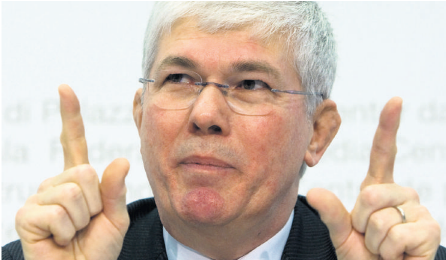
Finma-Präsident Eugen Haltiner: Laut Bericht Schlimmeres abgewendet

Untersuchungsbericht zur UBS-Krise und US-Steueraffäre