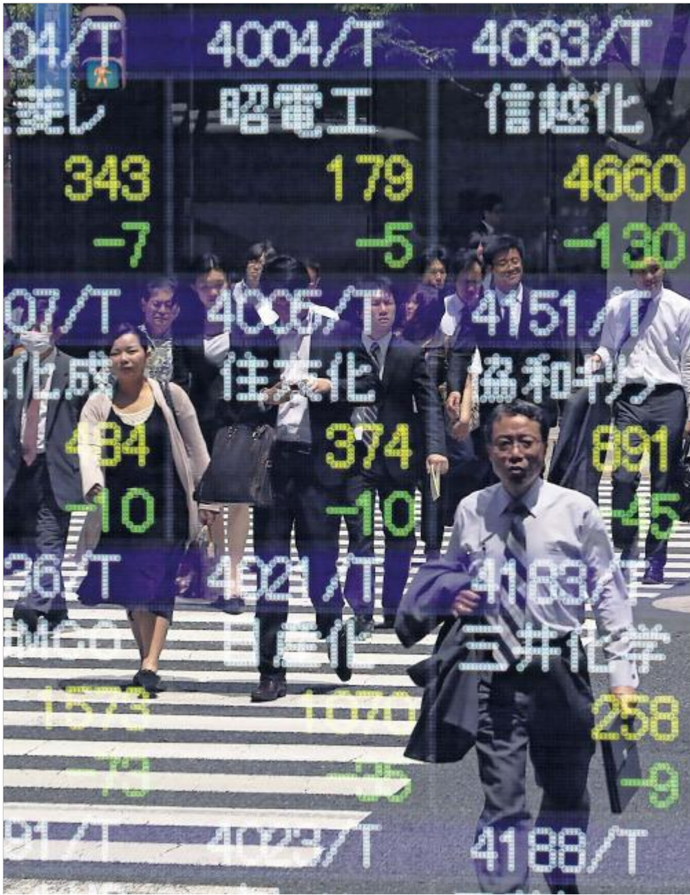
ZURÜCK ZUR PROSPERITÄT? Passanten vor der Tokioter Börse.

Bereits als Finanzminister hatte sich Kan für eine Erhöhung der Mehrwertsteuer