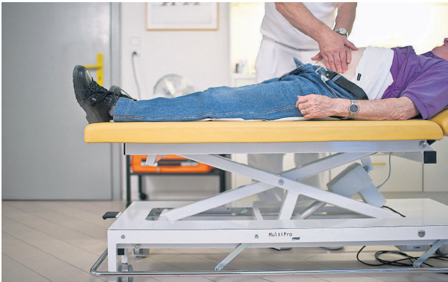
Hausarzt: Selbst für gut laufende Praxen gibt es keine ernsthaften Schweizer Interessenten

Weil Schweizer kein Interesse haben, übernehmen Deutsche unsere Arztpraxen